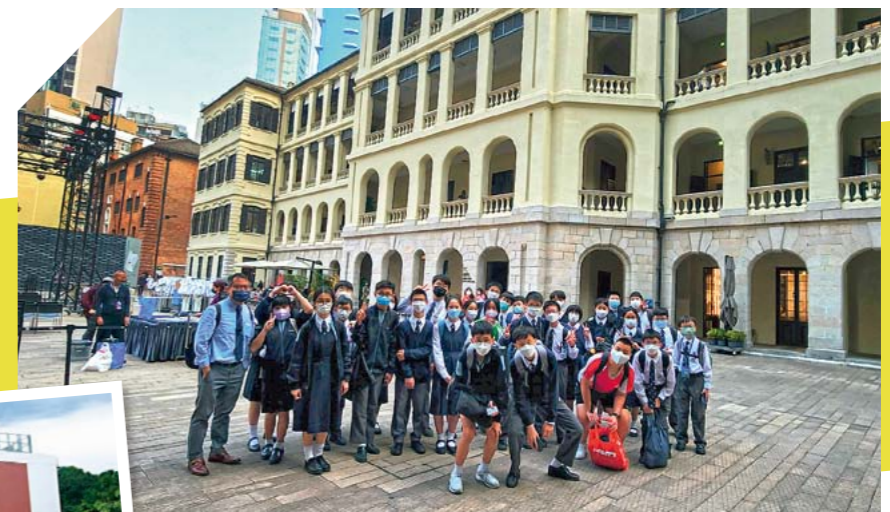
●學生參與不同活動，擴闊視野。