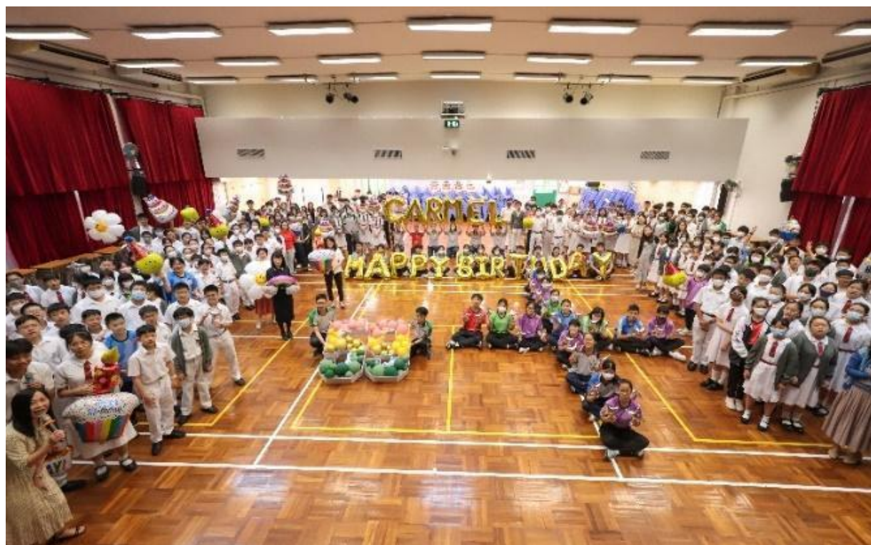
迦密中學 59 週年慶祝活動